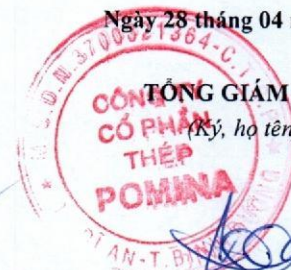
ĐỖ TIẾN SĨ